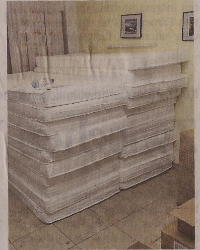
Lager: Einige Matratzen müssen noch verteilt werden.