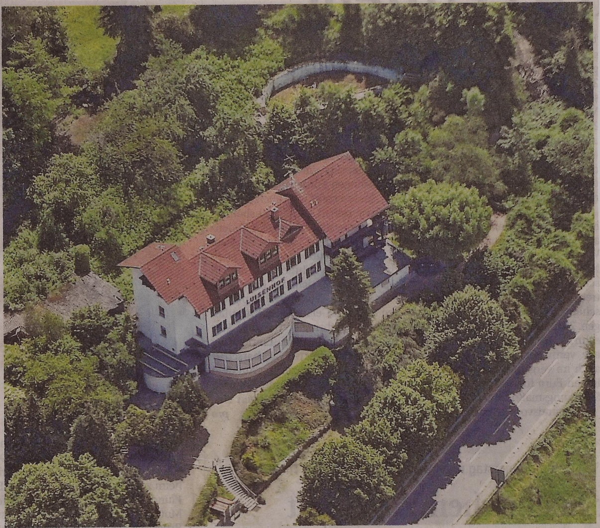
Der Luisenhof zwischen Hemsbach und Laudenbach wird Flüchtlingsunterkunft: Am Montag kommen die ersten.