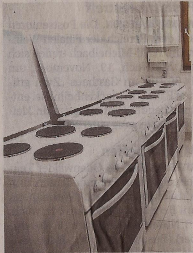
Hier wird gekocht: Drei Küchen stehen für bis zu 80 Flüchtlinge zur Verfügung.