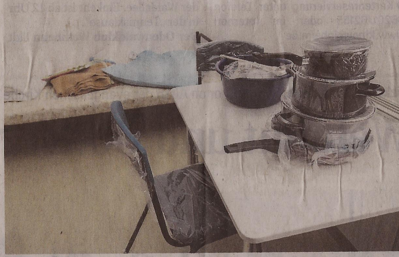
Die Zimmer sind größtenteils bereits möbliert: Jedem Flüchtling stehen 4,5 Quadratmeter zur Verfügung.