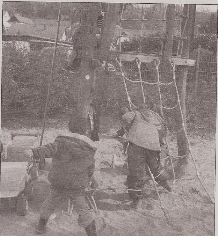
Der große Spielplatz lädt ein zu toben und zu klettern

betreuung (täglich 8 bis 12.30 Uhr, Montag bis Donnerstag 14 bis 16 Uhr) und der verlängerten Öffnungszeiten (täglich 7.30 bis 14 Uhr) eine Ganztagsbetreuung (Montag bis Donnerstag von 7.30 bis 16.30 Uhr, Freitag von 7.30 bis 14 Uhr) an. Sowohl für die Kinder der verlängerten Öffnungszeiten als auch bei einer Ganztagsbetreuung besteht täglich die Möglichkeit eines warmen Mittagessens. Das Essen wird in der eigenen Küche direkt vor Ort zubereitet. „Dabei wird natürlich auf sämtliche Geschmacksverstärker und Konservierungsstoffe verzichtet“, sagt Karin Braasch.