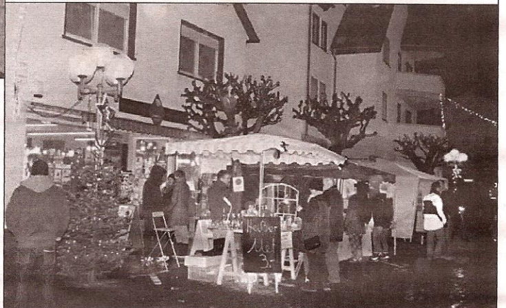
Trotz Regens gut besuchter Lichterglanz in der Bachgasse

ter nicht ganz so mitgespielt hatte - der Hemsbacher Lich-