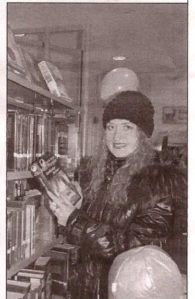
Bücher, Bücher, Bücher - für jeden Geschmack ist was dabei

Lesefreudige haben nun sonntags in der Zeit von 10 bis 12 Uhr, am Dienstag von 9 bis