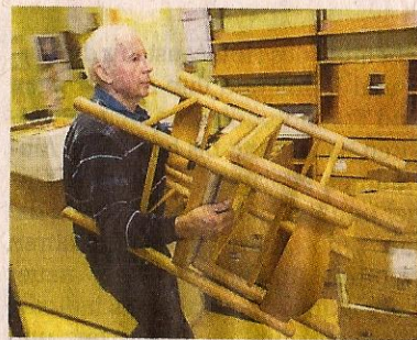
Und jetzt noch die Stühle: In den neuen Räumen wird es auch Lesecken geben.

Die liegen zentraler und sind deutlich größer als an der Gartenstraße. Die Streich- und Tapezierarbeiten haben Büchereimitarbeiter selbst übernommen. Ein neuer strapazierfähiger Kunststoffbelag, in den sich die Regale nicht reindrücken, wurde vom Fachmann verlegt; eine Firma sanierte auch die Toiletten in den früheren Voba-Räumen und baute einen neuen Abschluss