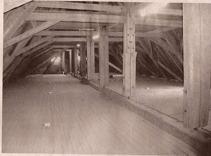
Beeindruckend ist die Größe des Speichers der St.-Laurentius-Kirche.

Zum „Tag des offenen Denkmals“ am Sonntag, 11. September, hatte die katholische Pfarrgemeinde die St.-Laurentius-Kirche geöffnet und einen seltenen Einblick in den Glockenturm und den Kirchenspeicher gewährt. Zahlreiche interessierte Besucher nutzten diese Gelegenheit, das ihnen bekannte Gotteshaus in einer anderen Sphäre zu erkunden. Mit seinen einführenden Worten erläuterte Pfarrer Winfried Wehrle die Geschichte des Gotteshauses, das nach dem Abriss einer Vorgängerkirche 1748 neu erbaut wurde. War die alte Kirche noch nach Osten hin orientiert, musste die neue Kirche aus Platzgründen nach Süden ausgerichtet werden. Erhalten blieb der alte Kirchturm, der der damaligen Zeit entsprechend dem barocken Neubau angepasst wurde und seinen heutigen Zwiebelturm erhielt. Die von den katholischen und reformierten Christen gemeinsam genutzte