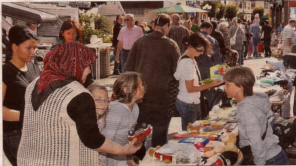
Auf Schnäppchenjagd: Der Flohmarkt war in diesem Jahr besonders gut besucht.