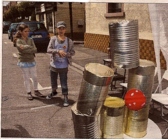
Treffsicher ging es durch die Bachgasse.