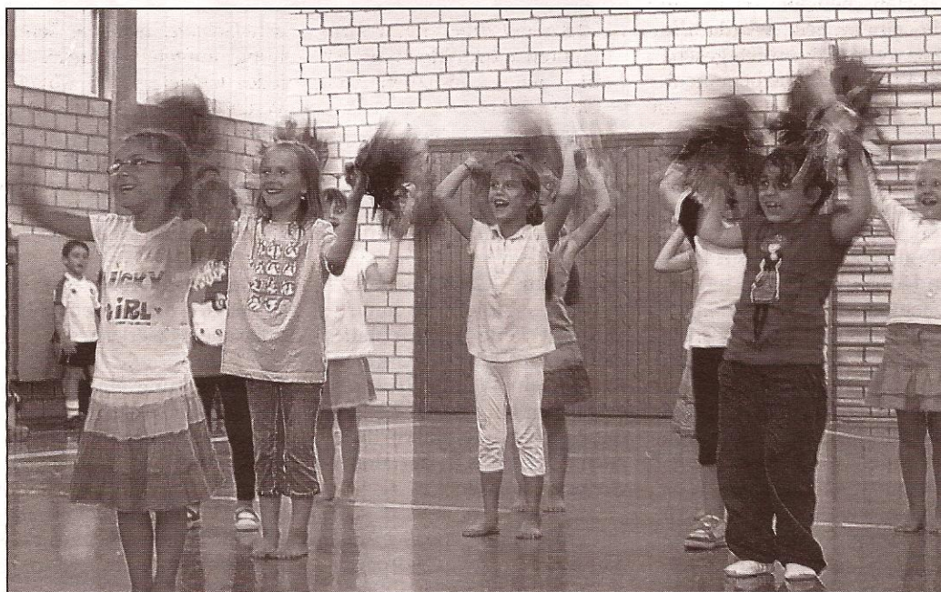
Auftritt der Cheerleadergruppe