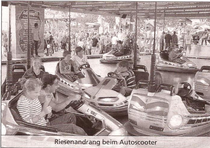
Riesenandrang beim Autoscooter