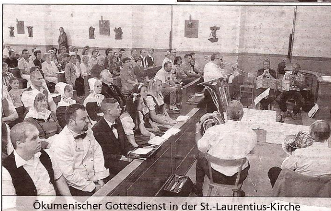
Ökumenischer Gottesdienst in der St.-Laurentius-Kirche