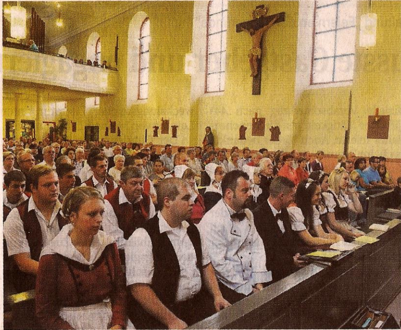
Die Kerwe erinnert an die Weihe der St.-Laurentius-Kirche: Die Repräsentanten des Volksfestes waren gestern in großer Zahl zum Kerwe-Gottesdienst gekommen.