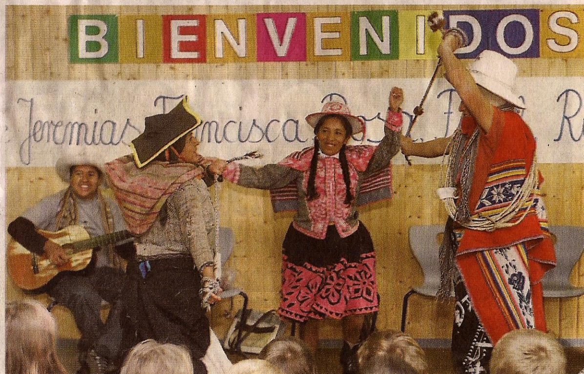
Willkommen: Das sind die Gäste aus dem peruanischen Santo Tomás in Hemsbach, Laudnbach und Sulzbach, die vom 2. bis 15. Juni an die Bergstraße kommen, um das 20-jährige Bestehen der Partnerschaft mit der Seelsorgeeinheit Hemsbach zu feiern. Unser Bild ist bei einem Besuch im Jahr 2004 in der Hebelschule entstanden.