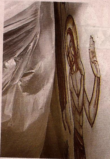
Das Taufbild bleibt an seinem Platz und wird saniert.