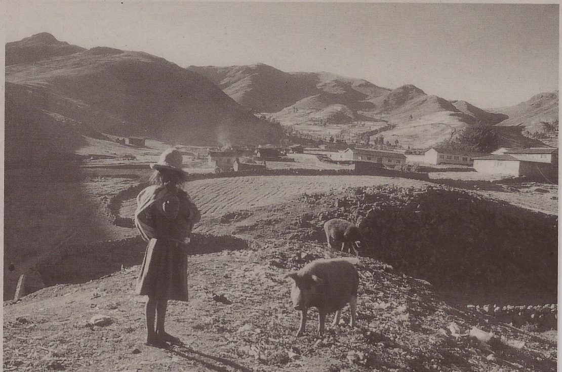
Reiches Land und arme Bevölkerung. Die Perugruppe der Seelsorgeeinheit Hemsbach will im Gottesdienst am Erntedank-Sonntag, 1. Oktober, das Thema „Bergwerk in Peru. Reichtum geht – Armut bleibt“ thematisieren und den Gottesdienstbesuchern im Pater-Delp-Gemeindehaus mit Vortrag und Ausstellung näherbringen.

Verteidigung der Grundrechte der Bevölkerung gegenüber den Konzernen informiert: Recht auf Information, auf Trinkwasserversorgung, auf Einhaltung von Mindestnormen zum Umweltschutz. Im vergangenen Monat hat in Santo Tomás ein Forum für „Bergbau und Landwirtschaft“ getagt. Sobald es eine klare Forderung gibt und die Verhandlungen mit der Regierung beginnen, wird auch die Perugruppe von hier aus die Bevölkerung in der Region der Partnergemeinde Santo Tomás unterstützen.