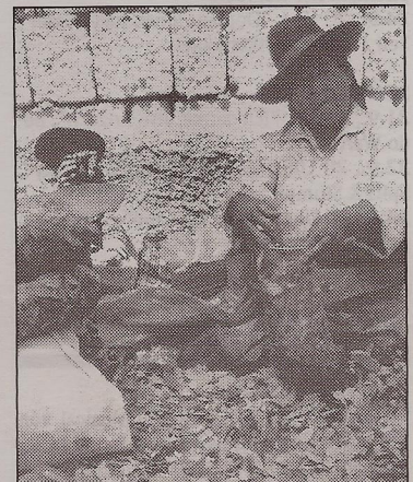
La Hoja de Coca – Frau mit Kokablättern