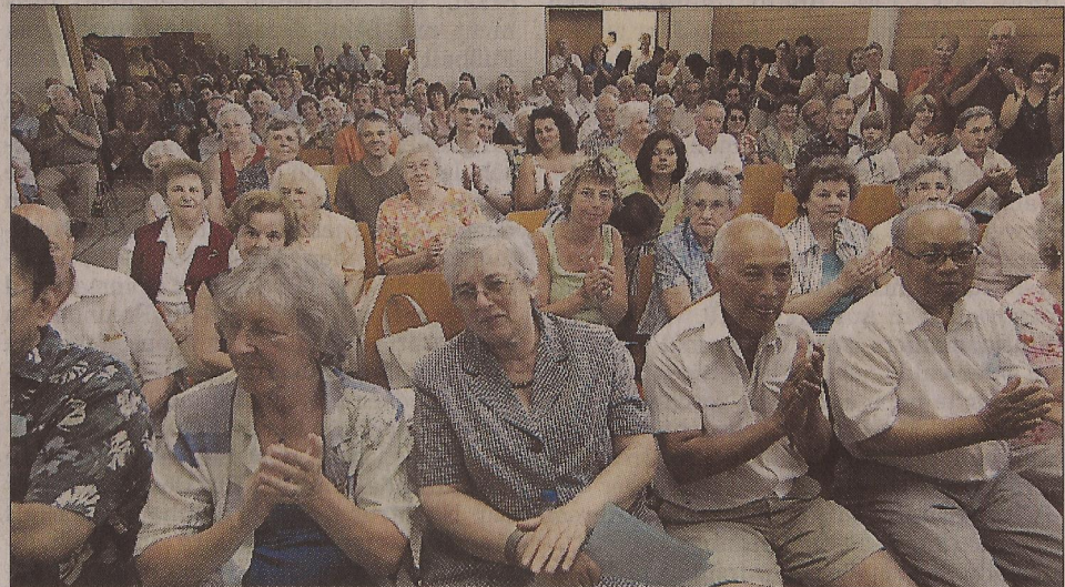
Begeistert: Voll besetzt war das katholische Gemeindezentrum in Sulzbach beim Benefizkonzert zu Gunsten der Erdbebenopfer in Indonesien.

Maya, Ery, Dhani und Dewi zeigten mit dem „Yapong-Tanz“ einen Empfangstanz für die Fischer, die nach dem Fischfang zu ihren Familien zurückkommen. Der Tanz