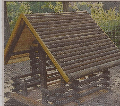
Jetzt ist es wieder sicher: das Spielhäuschen im Garten des Pater-Delp-Kindergartens.

Hemsbach. (ETH) Einige freiwillige Helfer des CDU-Stadtverbands haben jetzt das Dach eines Spielhäuschen am Pater-Delp-Kindergarten repariert. Dieses war verrottet und drohte zu einer Gefahr für die spielenden Kinder zu werden. Bereits in März fand eine Ortsbesichtigung mit anschließender Diskussion über eine geeignete Lösung statt. Hierbei fiel auch der sanierungsbedürftige Boden auf. Die Abmessungen des Spielhäuschens wurde ermittelt und der benötigte Materialbedarf aus diesen Daten errechnet. Während der Vorbereitung, in der die Grundkonstruktion der beiden Dachhälften von Erhard Thürauf erstellt wurden, bot sich spontan FW-Stadtratskollege Arthur Brauch an, die notwendige Beplankung zuzusagen. Für diese überparteiliche Mithilfe bedankt sich die CDU Hemsbach sehr herzlich.