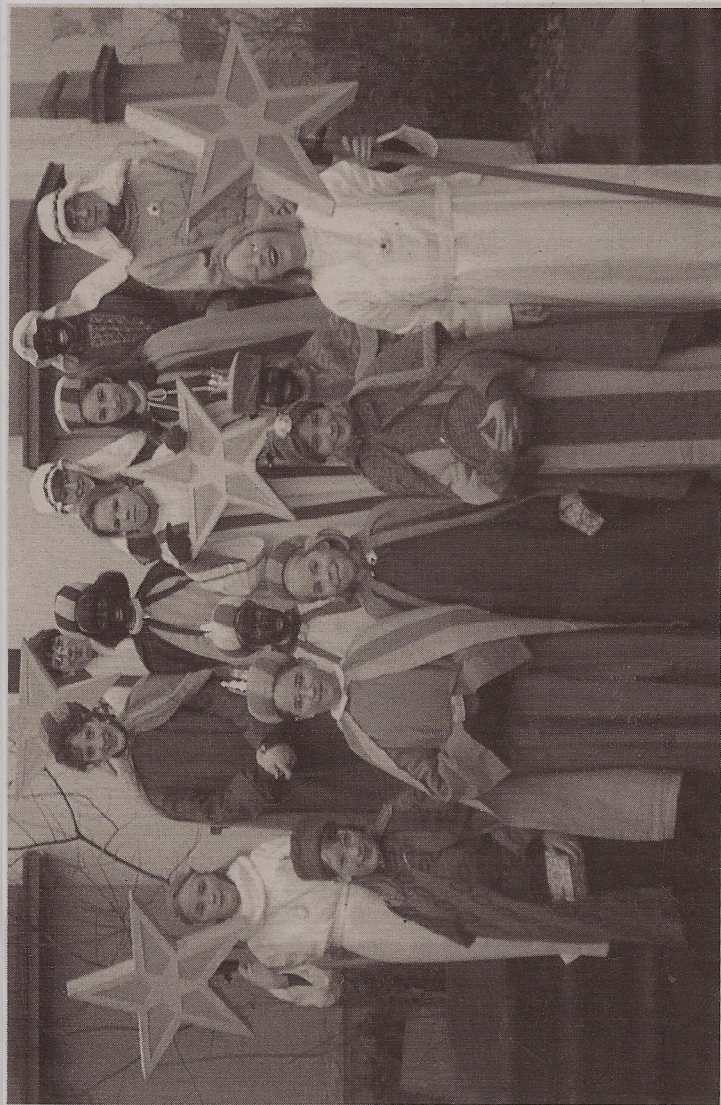
In der ersten Januarwoche sammeln die Sternsinger wieder für Kinder in aller Welt.

dass Kinder weltweit eine Chance auf Zukunft bekommen. Dazu gehört auch, dass den vielen Kindern, die zum Lebensunterhalt ihrer Familien beitragen müssen, die Möglichkeit zu Schulbesuch und Ausbildung geboten werden muss. Die Aktion „Dreikönigssingen“ ist die weltweit größte Solidaritätsaktion, bei der sich Kinder für Kinder in Not engagieren. Sie wird getragen vom Kindermissionswerk „Die Sternsinger“ und vom Bund der Deutschen Katholischen Jugend (BDKJ). Jährlich können mit den Mitteln aus der Aktion rund 2700 Projekte für Not leidende Kinder in Afrika, Lateinamerika, Asien, Ozeanien und Osteuropa unterstützt werden. Ausgesendet werden die Sternsinger am 1. Januar um 18.00 Uhr in der St.-Laurentius-Kirche. Dort feiern sie auch am Dreikönigstag (6. Januar) um 10.30 Uhr einen Dank-